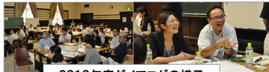
2010年度ダイアログの様子